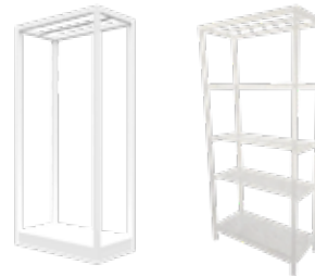
4. STRUTTURA APPENDERIA/ HANGING STRUCTURE mod. Campione, 98x50xH195 cm