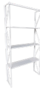
6. SCAFFALATURA/SHELVES STRUCTURE *da fissare a parete/to be fixed on the wall **portata max di ogni mensola/max capacity of every shelf 8 kg mod. White, 96x30xH200 cm €/cad. 74,00