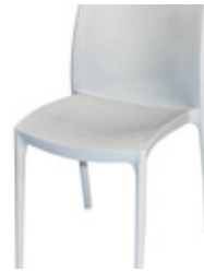
2. SEDIA/CHAIR mod. Star €/cad. 30,50