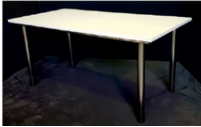
1. TAVOLO/TABLE mod. SC, 164x82xH73 cm €/cad. 76,00