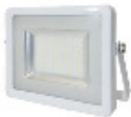
9. FARETTO/SPOTLIGHT 50 W €/cad. 50,00

Per assistenza tecnica Espositori e richiesta optional si prega di contattare For Exhibitors technical assistance and optionals request, please contact