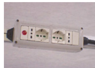
8. MULTI-PRESA ELETTRICA/MULTIPLE SOCKET €/cad. 45,00