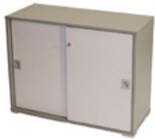
3. ARMADIETTO/LOCKER mod. Fly, 95x40xH73 cm €/cad. 84,00