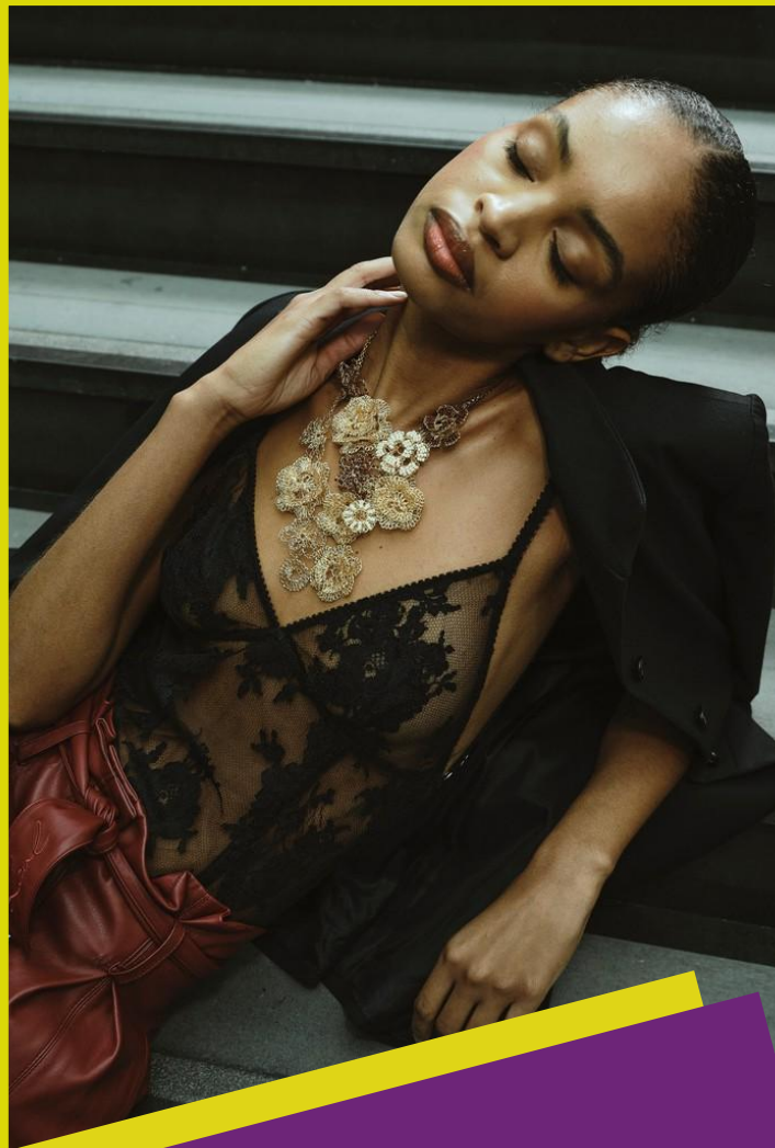
JEWELLERY CONTEMPORARY JEWELS