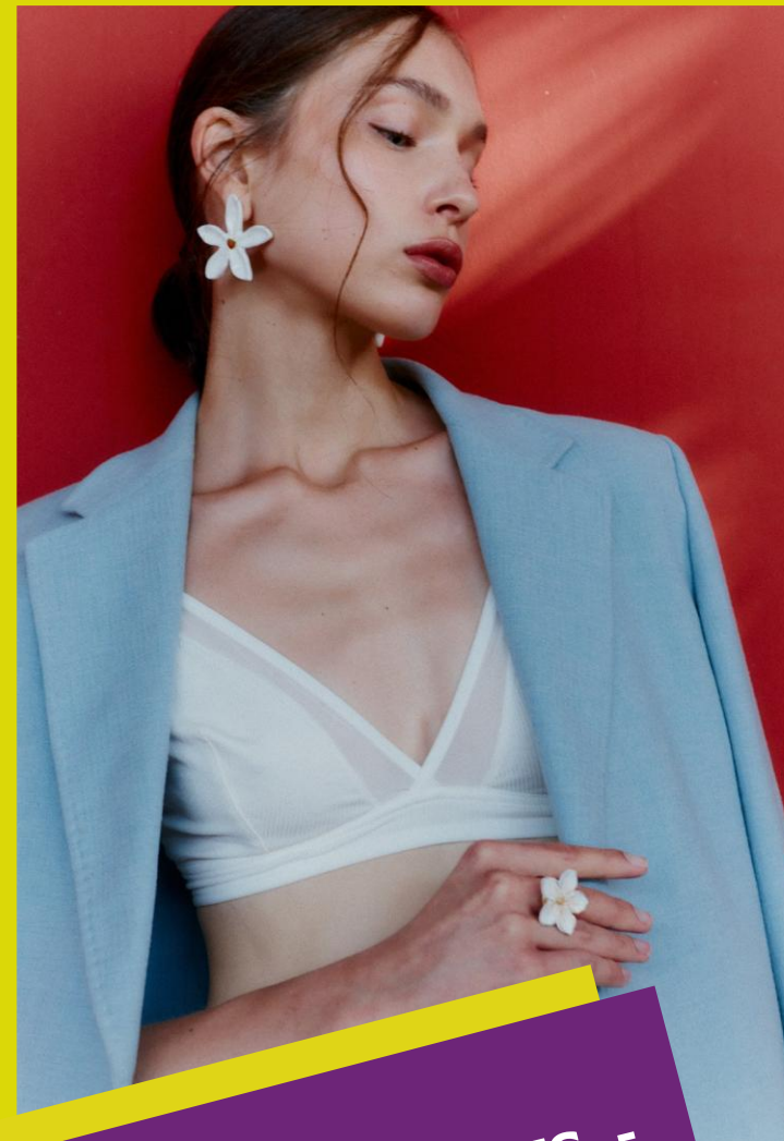
FASHION ACCESSORIES - FASHION APPAREL