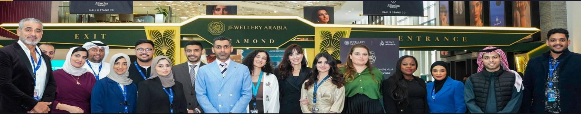
Jewellery Arabia – Είσοδος & Ομάδα Διοργανωτών | Exhibition World Bahrain