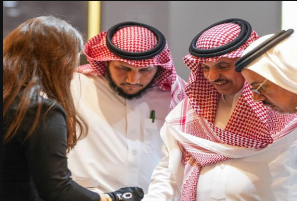
Αγοραστές από Σαουδική Αραβία