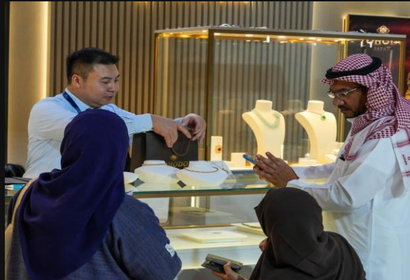
Πωλήσεις στο booth