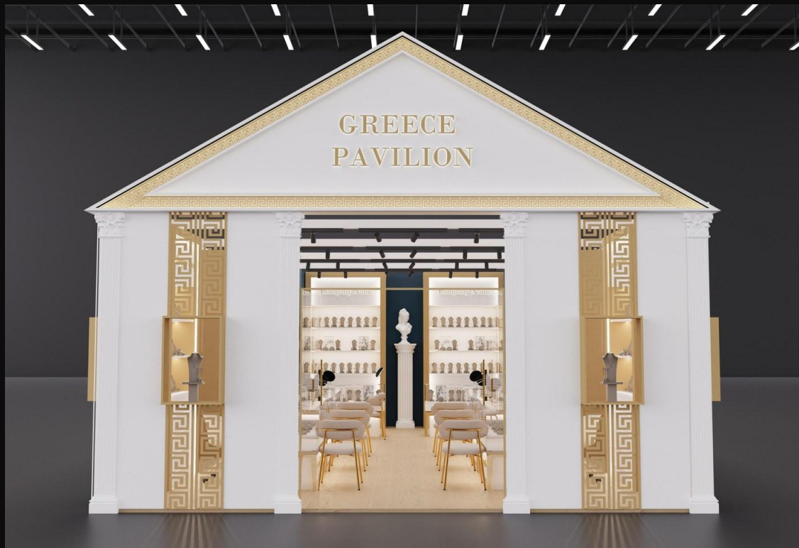
Εξωτερική Πρόσοψη – Μέτωπο (Front Facade)