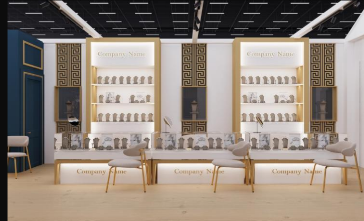
Side View – Display ανά Εκθέτη